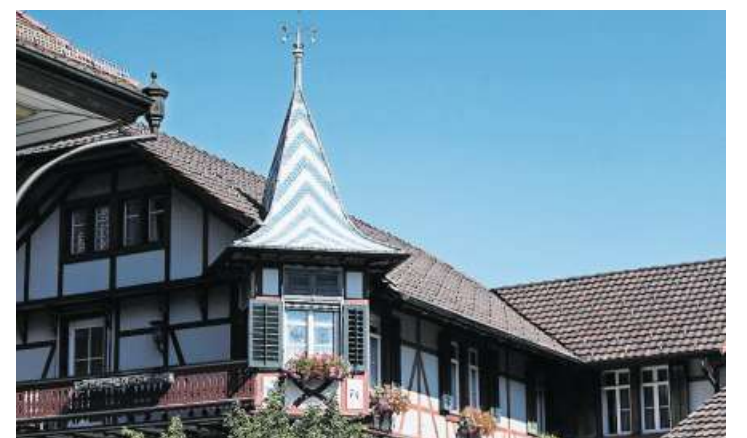
Wo steht dieses Haus mit dem blau-weissen Türmchen?

heute 13 Uhr erreichen, zweimal zwei Tageskarten der Zugersee-Schiffahrt. Diese gelten für Fahrten an einem Tag nach Wahl mit allen fahrplanmässigen Schiffskursen der Zugersee-Schiffahrt. Ihre Antwort schi-